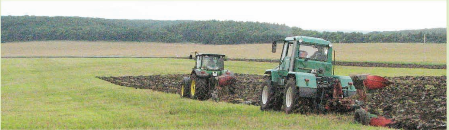
Трактори John Deere 7830 і "Слобожанець" ХТА-200 з 5-ти корпусними оборотними плугами ПО-5, (ЗАТ "ІНТЕРАГРОТЕК", Україна)

Машинотракторні агрегати на базі тракторів "Слобожанець" добре зарекомендували себе на полях України, Росії, Казахстану й інших країн.