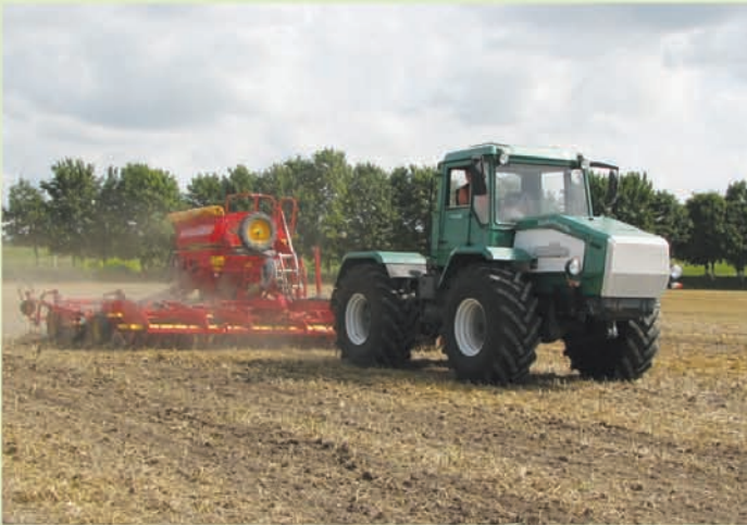
Трактор "Слобожанець" ХТА-200 з пневматичною сівалкою "Rapid" RDA 600C (Vaderstad, Швеція)