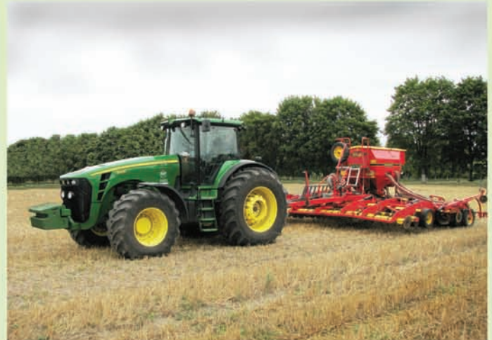
Трактор John Deere 8430 з пневматичною сівалкою "Rapid" RDA 600C (Vaderstad, Швеція)